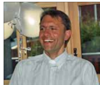
av Harald Dønnestad

Gårsdagen er en dag jeg vil huske og gjemme på med glede! Om lag 40 mennesker fra de fleste generasjoner satt rundt bord i kirken og delte tanker om hva som bør kjennetegne oss som menighet, og hva vårt oppdrag er.