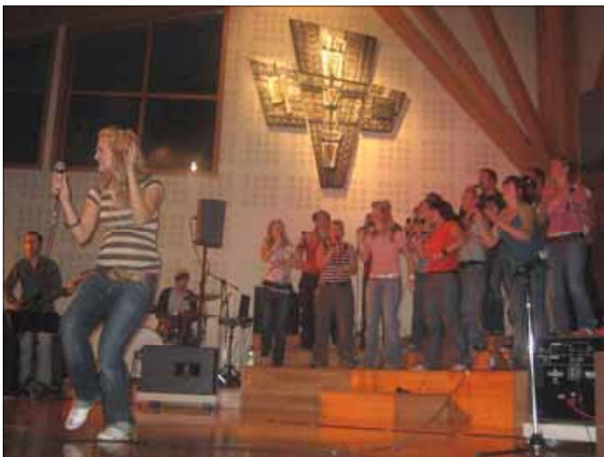
Norwegian Gospel Voices teller 25 medlemmer