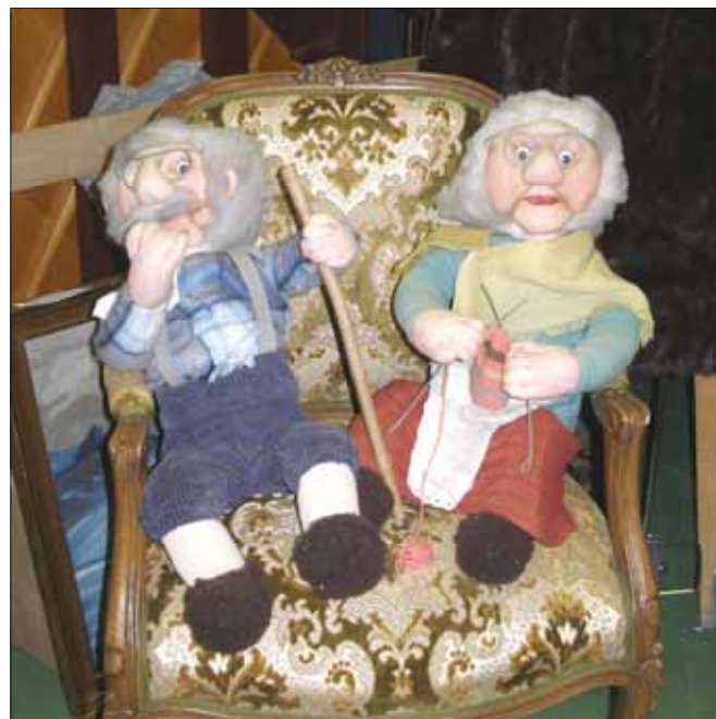
Dette ekteparet ble solgt under auksjonen på fredagskvelden.

Gigantloppemarkedet er slutt. 16 år og over 3 millioner kroner etter starten er det over.