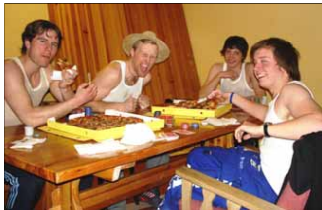
Gutta i B.O.S.S.

kirken så langt i høst. På programmet har det også vært en øvelseshelg med Oslo koret NGV-Norwegian Gospel Voices, etterfulgt av konsert i kirken. Senere i høst skal ungdomsgruppa på besøk til Fredrikstad, og første helg i advent er det duket for den årlige Trovassli-turen.