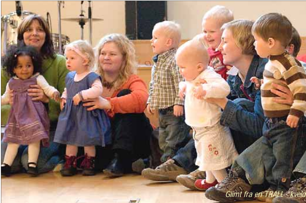
Glimt fra en TRALL-kveld