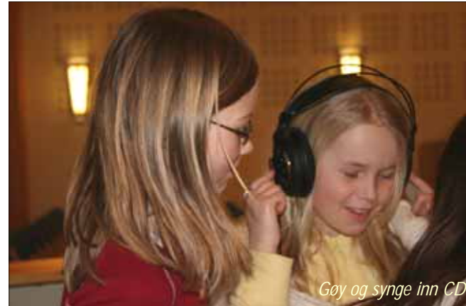
Gøy og syng inn CD

Vi vil ditt barn om Jesus lære, tegn og mal med dine kjære.