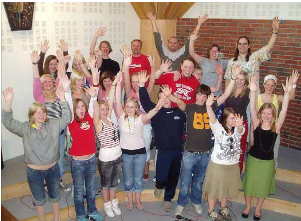
Ungdomskoret Con Amore

Er du mellom 13 –20 år kan du velge mellom Con Amore, B.O.S.S, samtalegrupper og en mengde turer og samlinger.