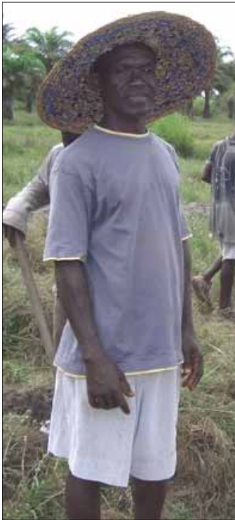
En blind mann som jobber på jordstykket som han har fått tildelt

Vi fikk se hvordan en stor gruppe blinde, jobbet på et jordstykke. Her skulle de dyrke sine egne vekster i stedet for å gå rundt å tigge. De manglet imidlertid en del redskaper og såkorn og det var dette de ba om hjelp til.