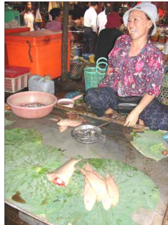
Hektisk salgsaktivitet på fiskemarkedet i Phnom Penh

I Phnom Penh fant vi en engelskspråklig, fillipinsk baptistmenighet som vi trivdes veldig godt i. Kirka var et uanselig hus, med stor aktivitet fra søndagsskole for hele familien, til bønne-