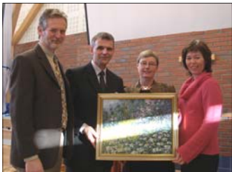
Gaveoverrekkelse på gudstjenesten