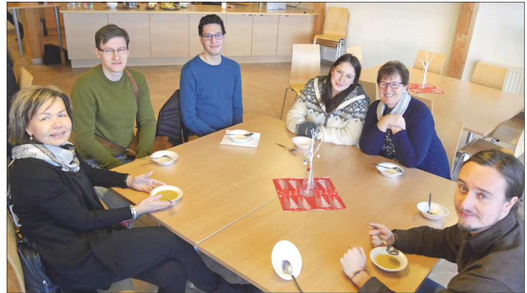
Internasjonalt fellesskap etter gudstjenesten

Nå ut! Som en kirke er deres mål å forherlige Gud i alt de gjør, og å være trofaste overfor Jesu kall om å forkynne