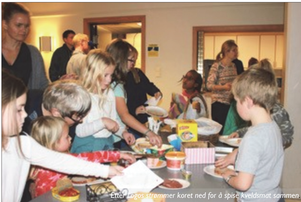
Etter Logos strømmer koret ned for å spise kveldsmat sammen.

Hvordan kan vi som menighet bygge fellesskap på tvers av generasjoner? Dette spørsmålet resulterte i Supertorsdag – et tilbud annenhver uke med fokus på å skape nye, sterkere relasjoner mellom barn, ungdom og voksne i kirka.