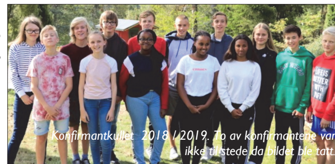
Konfirmantkullet 2018/2019. To av konfirmantene var ikke til stede da bildet ble tatt.

Det er selvsagt utelukkende positivt med en så stor konfirmantgruppe. Den store gruppa skaper bare en liten utfordring: Vil det være mulig å ha bare én konfirmasjonsgudstjeneste 12. mai? Det er heldigvis et hyggelig «problem». Det kan være ulike grunner til at så mange ungdommer vil være med i vår kirkes opplegg. Det helt sikkert fint med tur til Trovassli og Vegårshoi, men tidligere konfirmanter sier at turen til Latvia i vinterferien er det som har gjort aller mest