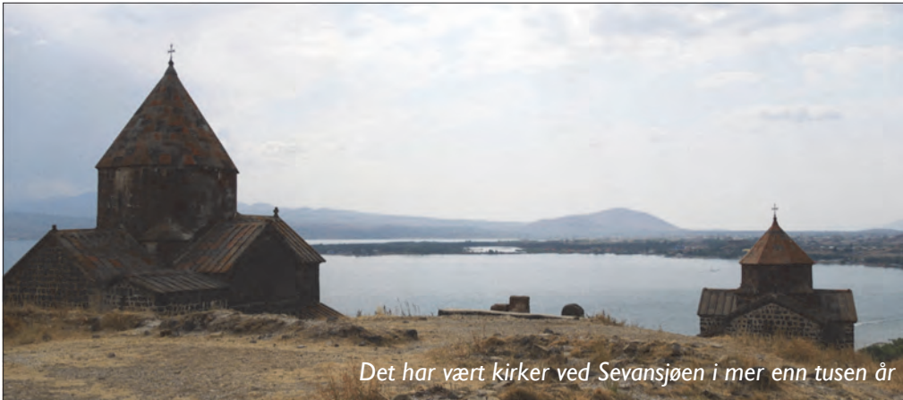
Det har vært kirker ved Sevansjøen i mer enn tusen år

finner en verdifull perle. Gudstjenesten inneholdt mange fine lovsanger med arabisk tonsetting. Det ble også gitt anledning til forbønn ved avslutningen av gudstjenesten. Denne kvelden ble sterke bånd knyttet mellom menigheten og gruppen fra Skien.