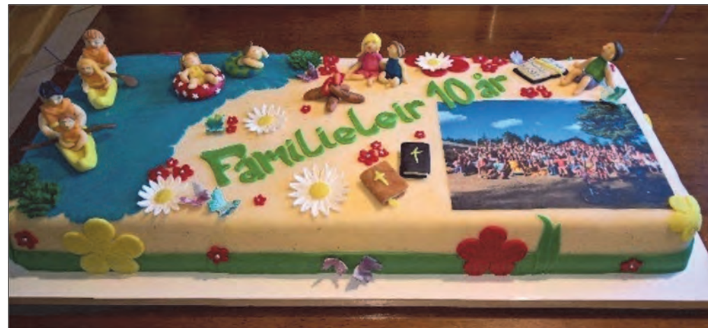
Jubileumskake hører med