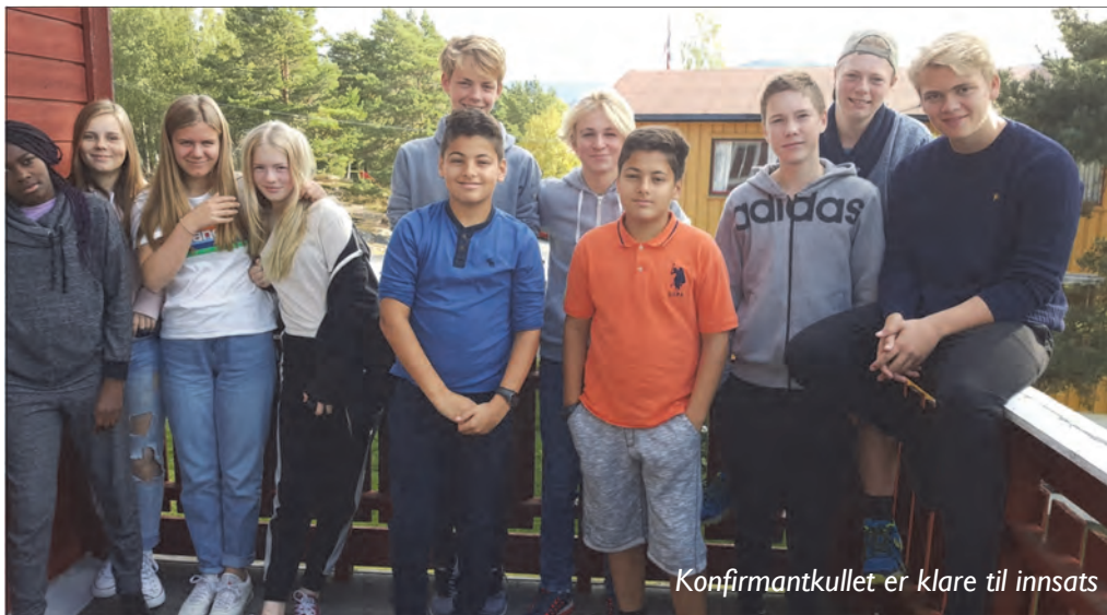
Konfirmantkullet er klare til innsats

Også årets konfirmanter i Skien baptistmenighet har til hensikt å dra på hjelpetur i vinterferien. En slik tur koster penger, og kanskje kjenner Veiviserens lesere til noe de kunne tjent penger på? Noe penger går med til å subsidiere noe av turen slik at alle konfirmanter har råd til å bli med, men det meste av det som samles inn, skal gå til innkjøp av mat og utstyr