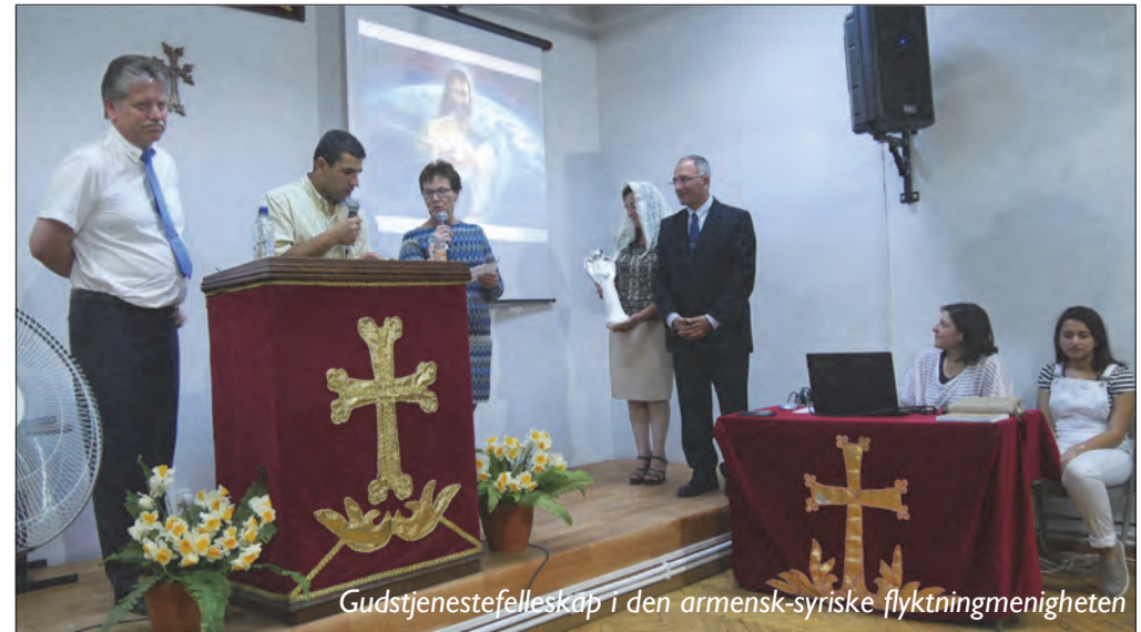
Gudstjenestefelleskap i den armensk-syriske flyktningmenigheten

land. Bakgrunnen er dramatisk. Gregor Lysbringeren ble fengslet når han forkynte det kristne budskapet, og satt i en trang hule i 13 år. Kong Trdat III ble syk, og Gregor Lysbringeren ba for han. Kongen ble helbredet, omvendte seg og ble døpt i år 301. Samtidig erklærte han at