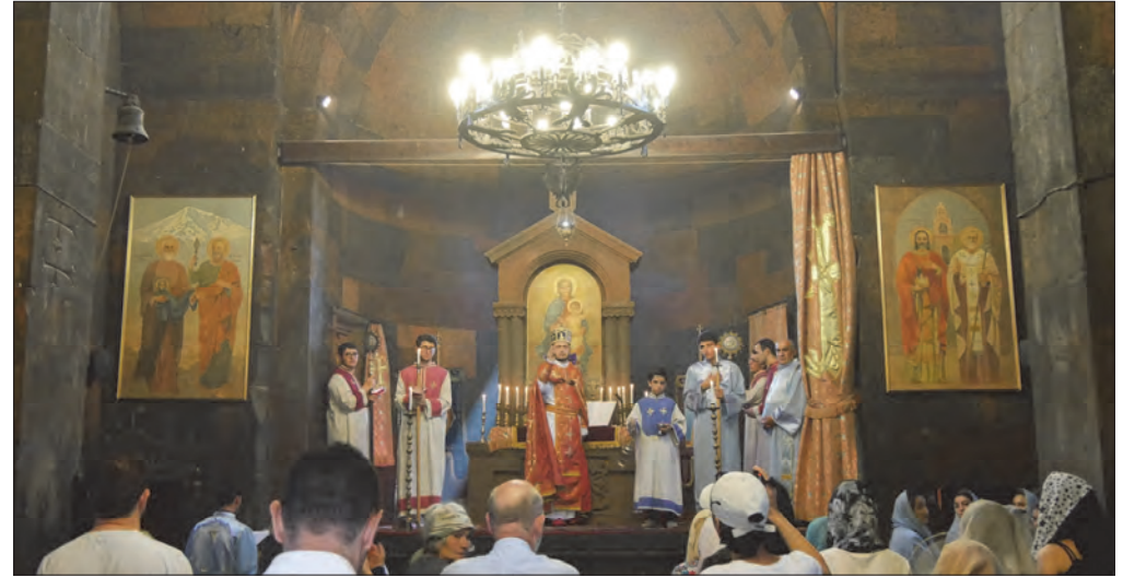
Ortodoks gudstjenestene i klosterkirken Khor Virad på sletten under Araratfjellet