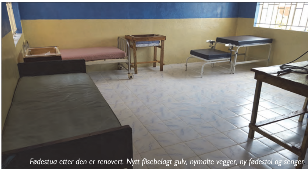
Fødestua etter den er renoverert. Nytt flisebelagt gulv, nymalte vegger, ny fødestol og senger.