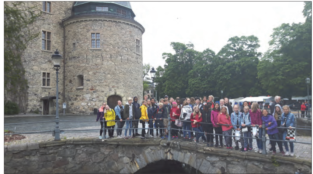
På sightseeing i byen

Lørdag formiddag sto utekonsert i sentrum på programmet. For å kunne