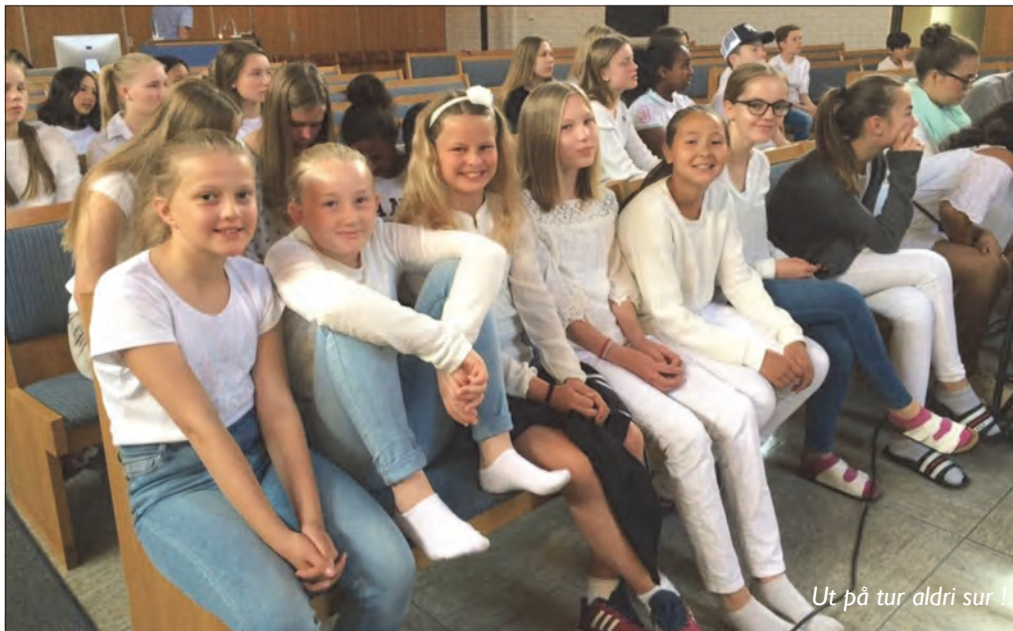
Ut på tur aldri sur!

med turen til Örebro?», var svarene mange: Det sosiale, å få være sammen, bli bedre kjent, badeland, bytur, utekonsert, syngende et annet sted, kveldssamlingene, gudstjenesten og enda mer.