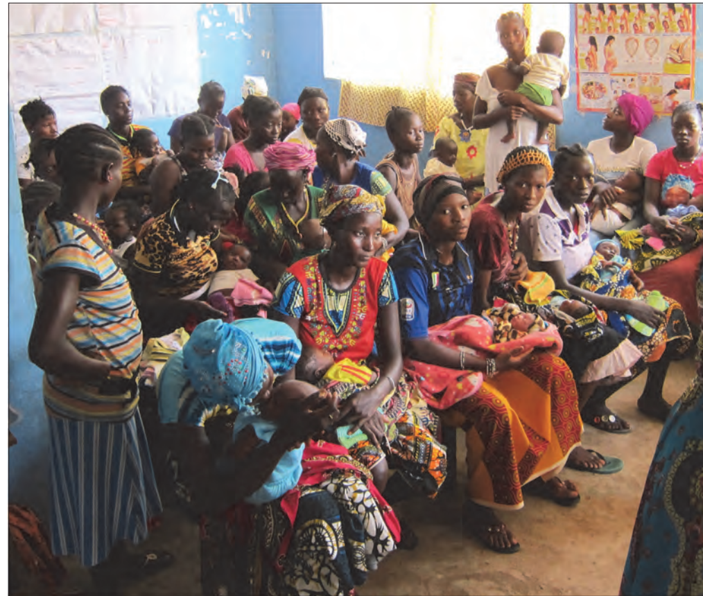
Vaksinasjon og fødselsundervising på klinikken.