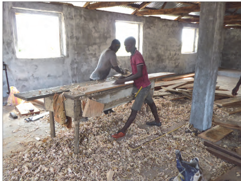
Snekkerne i gang med produksjon av benker

Det utføres viktig arbeid hver dag i disse landsbyene. 3 kirker, som lokale krefter selv har bygget opp, ble ferdigstilt med maling utvendig og innvendig, benker og talerstoler, alle klare til bruk. Pastorer og kirke-medlemmer hjalp til. De hadde før øvrig gjort alt det tunge byggearbeidet ferdig før den norske dugnadsgjengen kom.