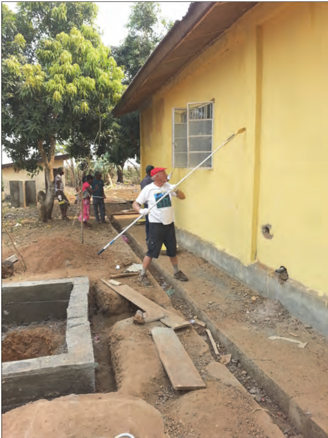
Malearbeid utvendig på klinikken. Ny septisk brønn i forgrunnen.

flislagt. En stor septisk brønn ble gravd, kanter murt opp og lokk støpt. Inne på fødestua ble det bygget dusj og toalett, med rør ut i tanken. Før måtte de som skulle eller hadde fått barn ut av bygget, over gårds-plassen og inn på ute-doen. Dette ble en