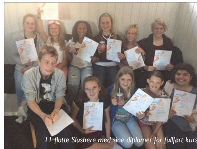
11 flotte Slushere med sine diplomer for fullført kurs

Vi gjennomførte kurset sammen med Pinsekirken Tabernaklet Fra oss var det 11 stykker som fullførte kurset, som gikk over 3 samlinger, en praksissamling og avslutningsfest. Kursets innhold var å lære om Sprell levende materialet, litt grunnleggende bibelkunnskap, om hvilke interesser og evner de selv har og hva de vil hjelpe til med i søndagsskolen (hvis de vil det). Det var noe teori på kurskveldene, aktiviteter og barna fikk øve på ting de kunne bruke i praksis. Og selvfølgelig fikk alle deltakere Slush å drikke hver gang.