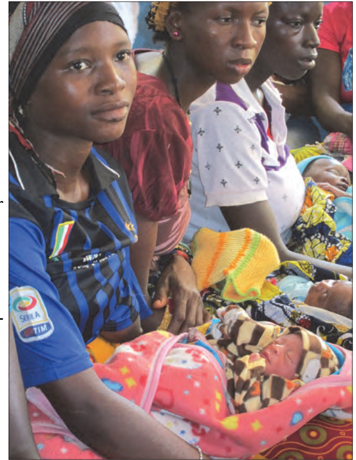
Utdeling av tøy til nyfødte.

Det er langt til lege og sykehus i Tonko Limba. På klinikken underviste de også helsearbeidere fra