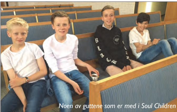
Noen av guttene som er med i Soul Children

Vi ledere var strålende fornøyde med å få være på tur med verdens snilleste barn og ungdommer, som følger avtaler og beskjeder, tar vare på hverandre, er sammen på tvers av alder og gir alt når de synger om Han vi tror på.