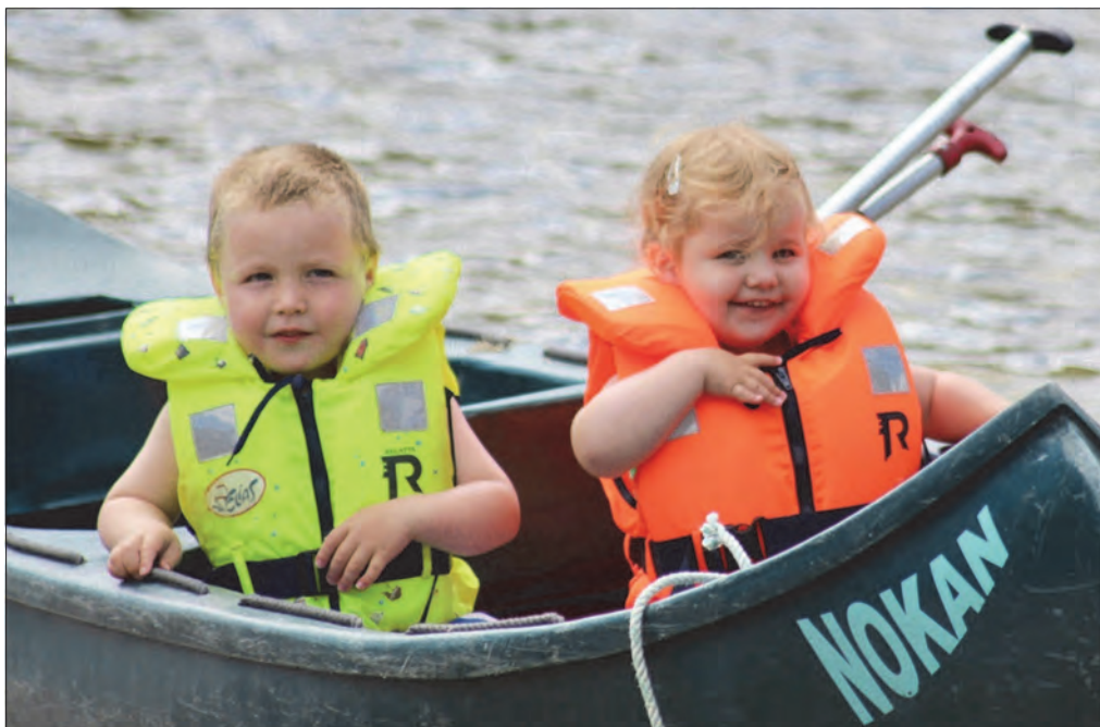
Kanoturer er moro for liten og stor på familieleirene