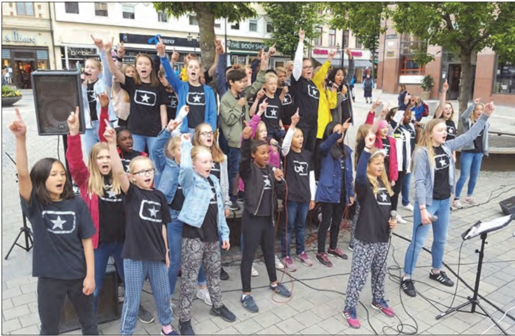
Soul Children med utekonsert i sentrum av Örebro

Fredag i pinsehelga fylte 49 sangere og ledere en flott turbuss med bagasje, sanganlegg, norsk brød og store forventninger til den første utenlands-turen for Skien Soul Children.