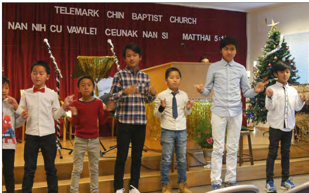
Sang av søndagsskolen på gudstjenesten 1. søndag i advent

Telemark Chin Baptist Church - TCBC, er en gruppe fra Chin staten i Burma. Vier en virkegren i Skien baptist menighet som består av 71 personer med barn og voksne. Vi har kjøpt et menighetshus på Østmo 2 i Skien og trives veldig bra