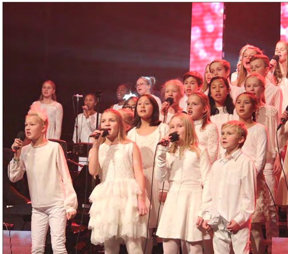
Soul Children var kjempeengasjerte og fikk flott omtale

stod nemlig oppdragene i kø for Skien Soul Children. Vi skulle delta på tre av showene i turnéen: «Julestemning på et Blunck, Bettan og Endresen», i Skien, Grimstad og Arendal. I tillegg skulle vi synge med Helene Bøksle på hennes julekonsert i Skien kirke. Og søndag 18. desember skulle vi