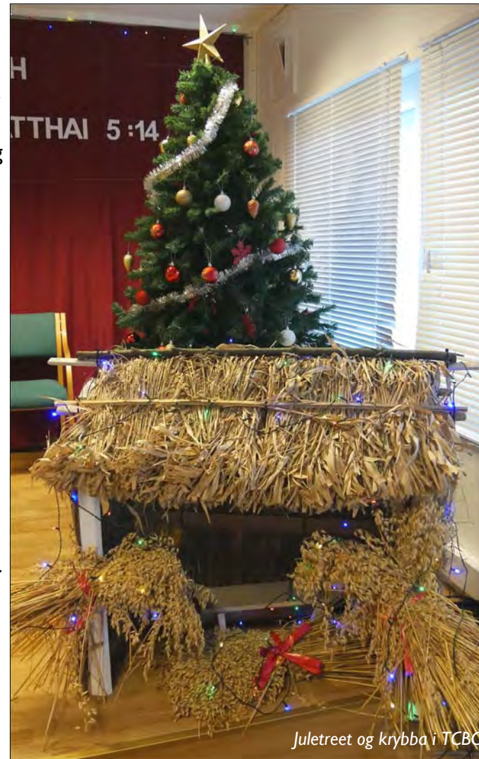
Juletre og krybba i TCBC

Hjemme i Burma var det vanlig å gi gaver i jula, til foreldre løse barn. Her i Norge har vi ikke kommet til noe spesiell gaveformål.