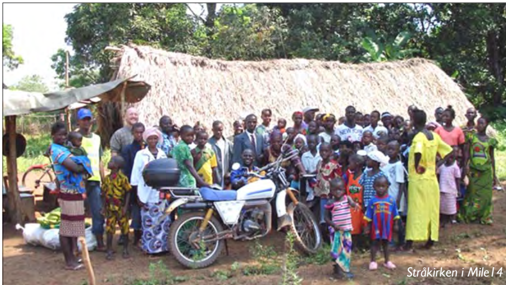
Stråkirken i Mile 14

Skien baptistmenighet samler på nytt dugnadsgrupper for å bidra til lokal utvikling i Sierra Leone.