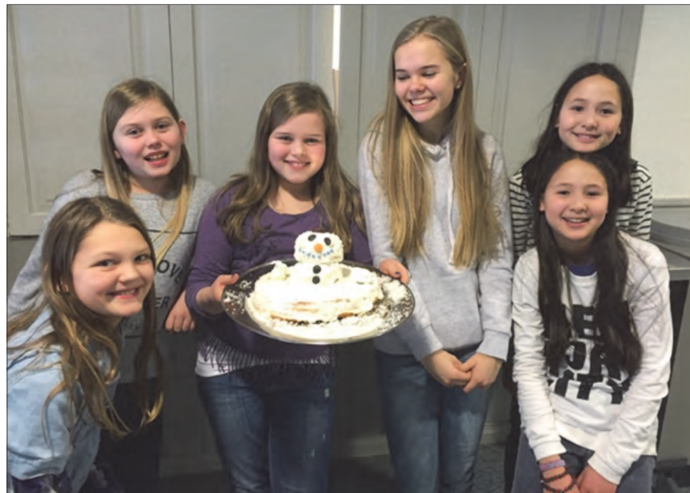
Et av jentelagene med sin flotte snømannkake!

Det var veldig god stemning på leiren. Fredagen begynte med stjerneorientering/poengløp i en helt mørk møtesal. Barna måtte lete etter «poster» med lommelykt i mørket.