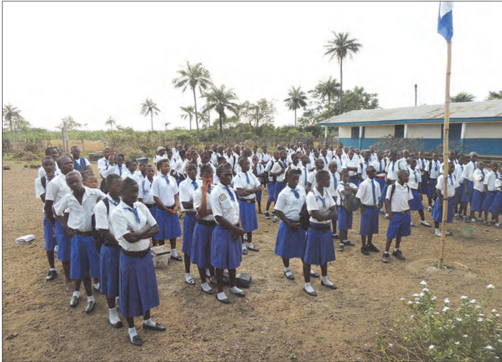
Nå har alle fått skoleuniformer og ingen skiller seg ut

Jeg tror alle som var med sist ble litt preget av oppholdet.