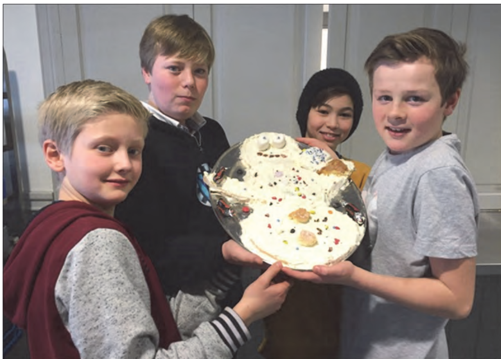
Gutta fra Skien, med sin unike snømannkake!

12.-14.februar var 50 barn og ledere samlet på juniorleir på Vegårtun. Det var deltagere fra Bærum, Kragerø og Arendal, i tillegg til den største gjengen som var fra Skien. Temaet var «Jeg er unik» og det tror vi alle barna fikk med seg.