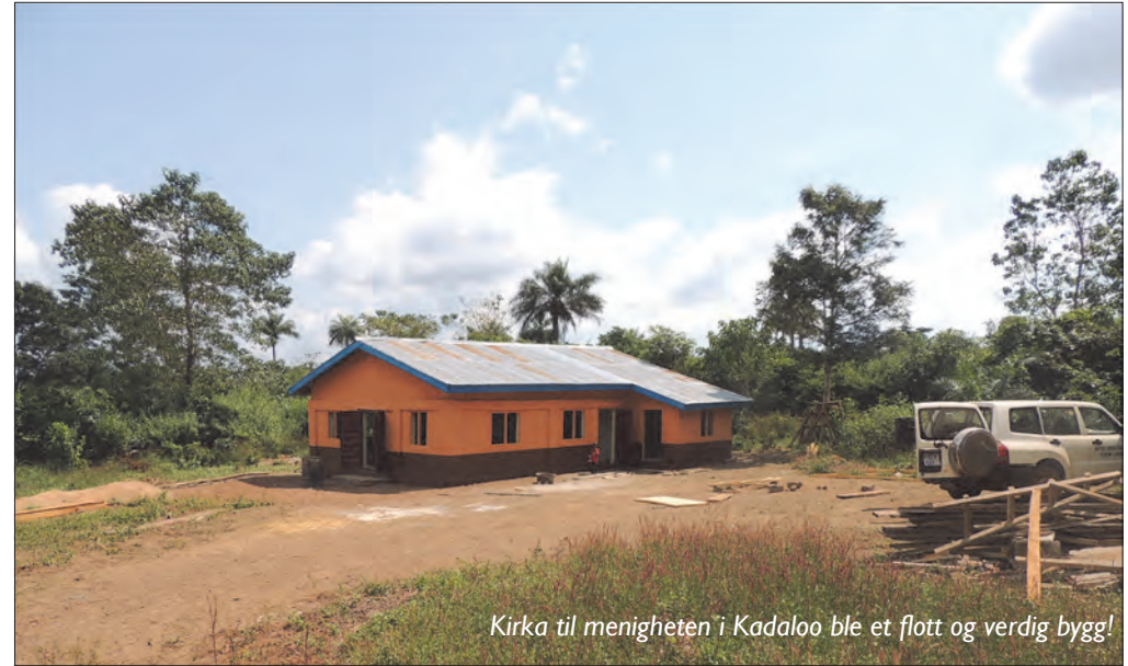
Kirka til menigheten i Kadaloo ble et flott og verdig bygg!

Det er selvsagt noen som av forskjellige grunner ikke var med på siste dugnadsinnsats, men som i stedet romslig sendte med penger, som ble brukt til å sette i stand en ødelagt brønn, innkjøp av geiter, høns, ris og andre livsnødvendige ting, for at de fattigste kunne få hjelp til selv-