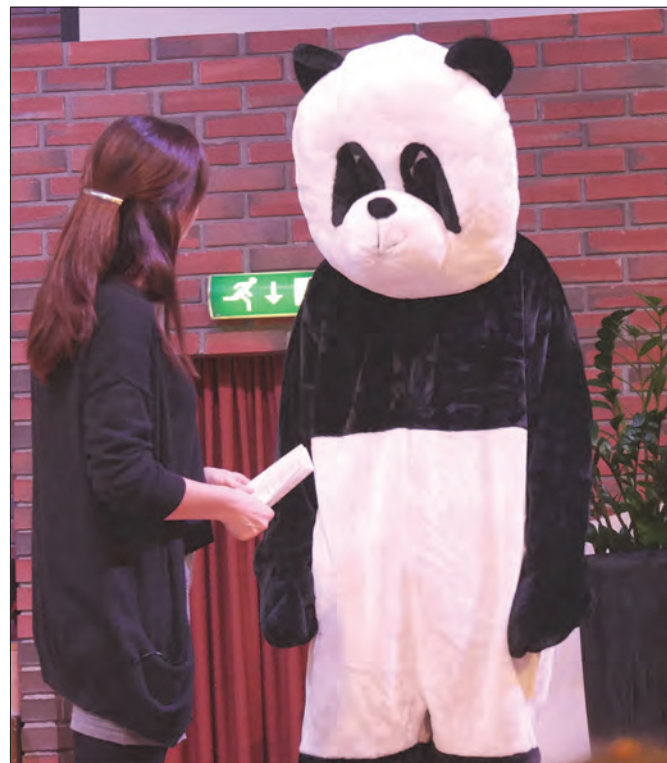
Pandrino er med på å skape morsomme innslag i gudstjenesten.

Beløpene til prosjektene har tatt høyde for høy dollarkurs.