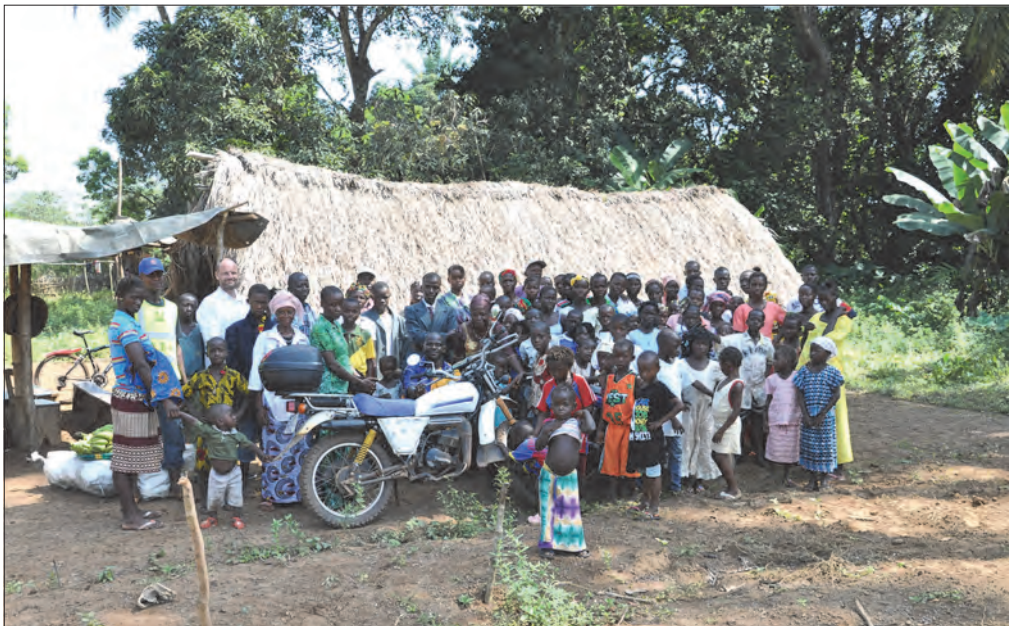
I landsbyen Mile 14. Her skal det bygges ny kirke.

.... Miliki, Kadaloo, Beyande... Dette er kjente og kjære navn for oss som var i Sierra Leone og jobbet i 2013