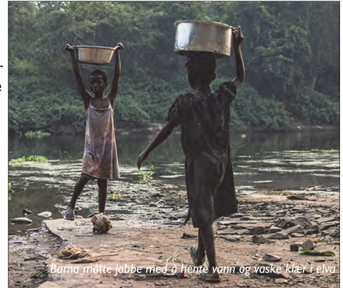
Barna måtte jobbe med å hente vann og vaske klær i elva

hver dag. De som bodde der derimot, de hadde rutiner på det de gjorde. For eksempel de som lagde mat til oss, de lagde mat omtrent hele dagen. Det tar lang tid å tilberede høne fra slaktning til marinade når de f.eks. ikke har maskiner som plukker fjæra av høna for de. Barna så vi som regel nede ved elva. De vaska klær eller henta vann til familiene sine.