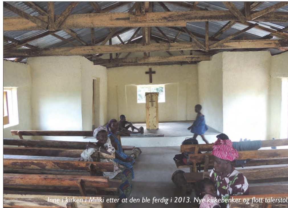
Inne i kirken i Miliki etter at den ble ferdig i 2013. Nye kirkebenker og flott talerstol.

Et bygg for opplæring av snekkere og systue har også vært nevnt. Vi jobber for at det skal bli en fornuftig prioritering, og stoler på at de som bor og jobber der, vet hva som gagnar befolk-