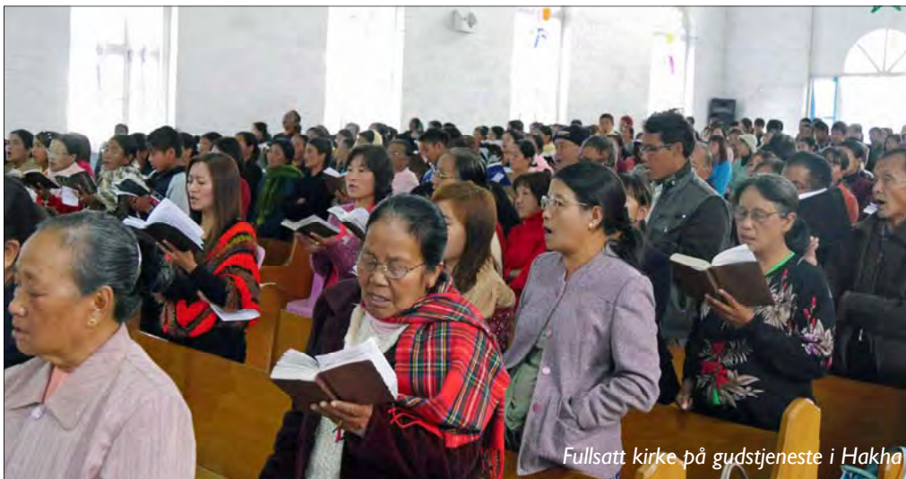
Fullsatt kirke på gudstjeneste i Hakha

vesen som kan gi veiledning og undervisning til folket. Men det viktigste er på plass. En urokkelig tro på Jesus Kristus som Herre og frelser.