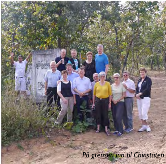
På grensen inn til Chinstaten