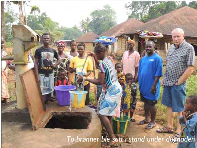
To brønner ble satt i stand under dagnaden

vanskelig. Spørsmål som: Hvordan vil det gå videre med arbeidet? Vil det vokse? Hva vil Gud videre? Dukker stadig opp i tankene hans. Han opplever også her at det er en del nominelle kristne også her, utfordringen er å få mennesker til å invitere Jesus inn i hverdagen.