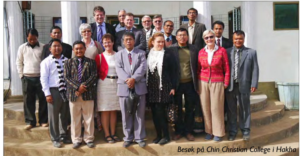
Besøk på Chin Christian College i Hakha