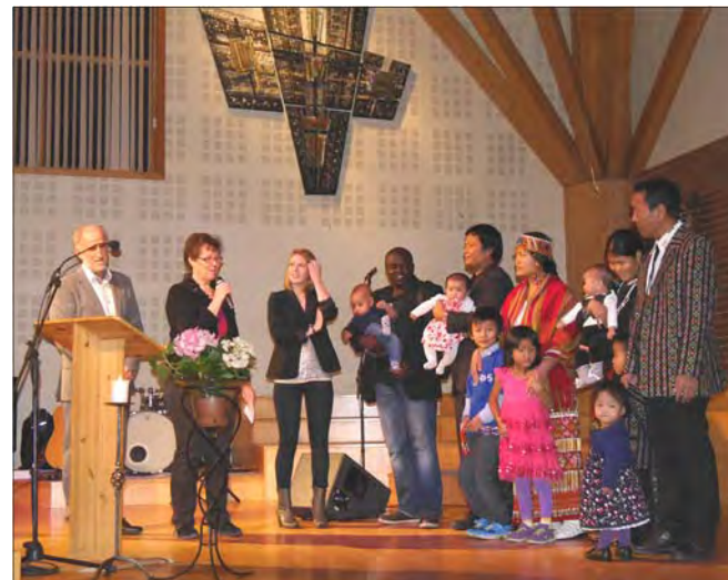
Barnevelsningen 17. november