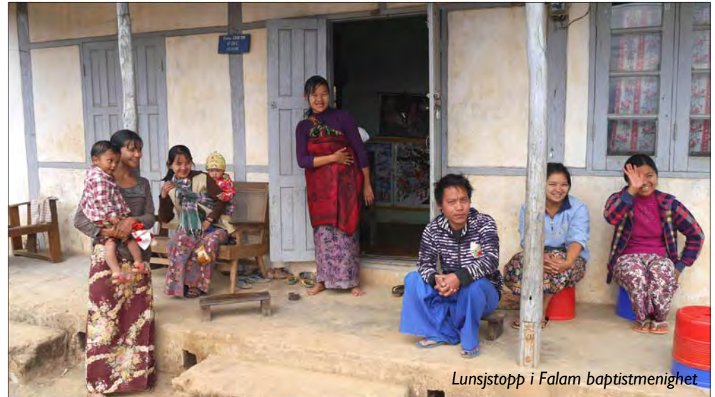
Lunsjstopp i Falam baptistmenighet

var kaldt la dette ingen demper på den gjestfriheten og varmen vi ble møtt med i kirkene som ble besøkt. Alle ønsket at vi skulle føle oss hjemme. Chinstaten har aldri vært