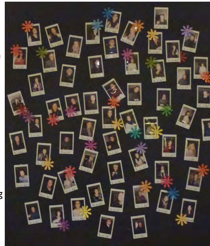
Avduking av årets medarbeidere viser bilder av alle som var til stede

Medarbeiderfesten er en fest hvor vi hyller og feirer hverandre. Her gis rosord til alle som har vært i kirken en gang eller dem som nesten bor der i løpet av uka. Alle er en viktig brikke i Guds plan.