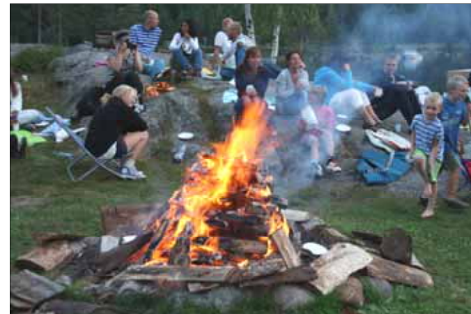
Leirbål - kos fra familieleiren på Vegårtun

det var gledestårer, altså. For da visste jeg at jeg hadde fått bønnesvar!"