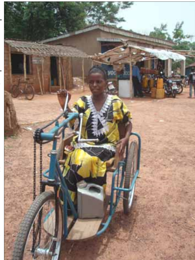
Handicap-sykkelen gir nye muligheter

"Etter noen år i tradisjonell misjonstjeneste ble det