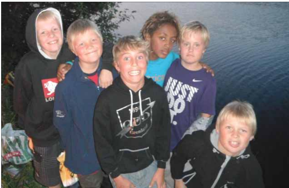
Friluftsgutta ved Slettevannet

12.-13.august startet Friluftsgutta sesongen med en overnattingsstur i lavvo på plassen vår, ved Slettevannet.