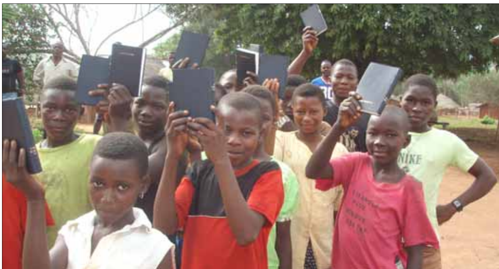
Bibelutdeling til 6.-klassinger

Sier en engasjert misjonær, som siden 2004 har vært 11 ganger i Kongo, hver gang med en varighet av 4-8 uker, kjøpt inn utstyr for noen tusen, kjørt mange mil for å dele ut, oppmuntre, lytte, hjelpe. En kvinne som har sagt ja til mange utfordringer. Som evner å se muligheter framfor problemer. Som bruker følgende ord om sin misjonstjeneste: "Dette er grådig moro!"