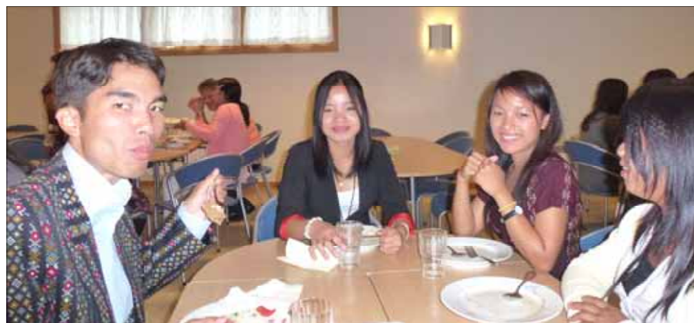
Glimt fra innvielsesfesten med deilig middag søndag 4. september

det Dette er et verdifullt oppdrag. Vai Vai ledet en dialog med forsamlingen, hvor det ble lest fra Rom 8, 35 og 37 - 39 og Filip. 2, 5 - 10 . Til slutt spiste alle en flott middag sammen.