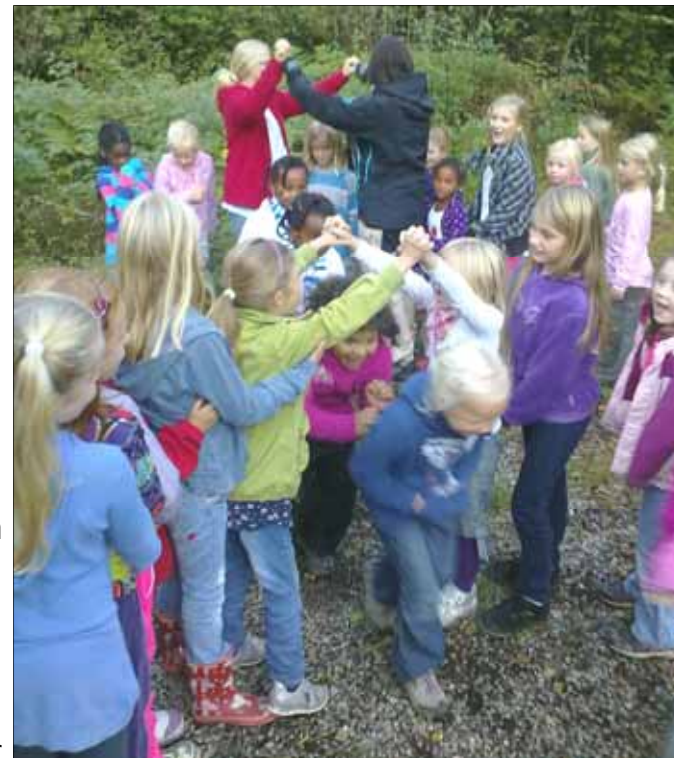
Jentesprell i full fart med "Bro - Bro brille."