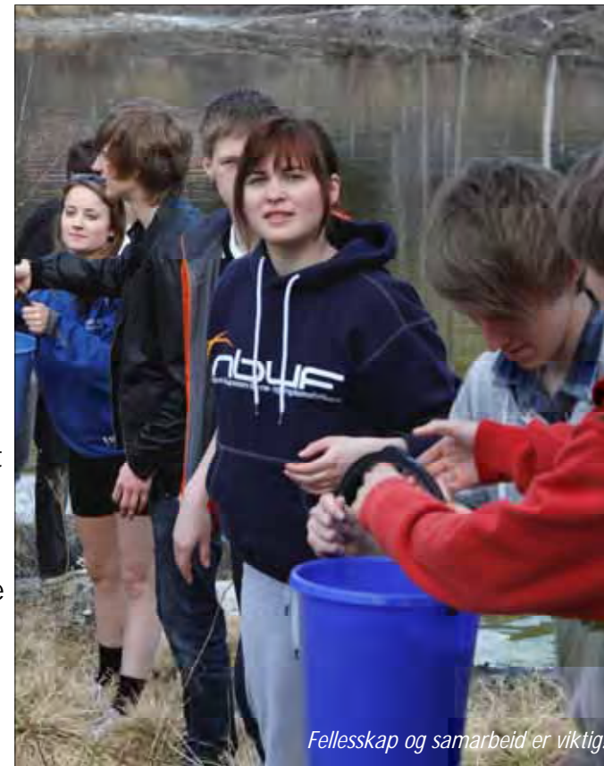
Fellesskap og samarbeid er viktig!

Noe annet jeg opplevde som veldig positivt, var