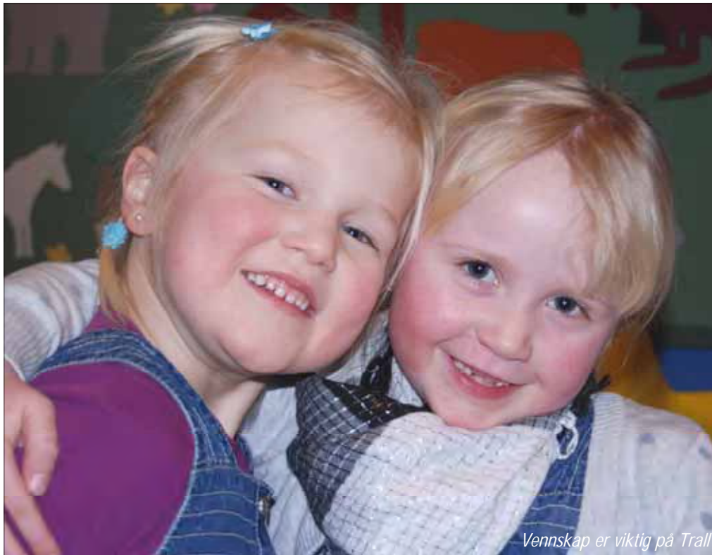
Vennskap er viktig på Trall

Torsdag 28. april hadde Trall sin årlige vår - avslutning i kirken. Der var foreldre, søsken, beste-foreldre og venner samlet for å feire barnas sprudlende innsats gjennom ti uker med Trall. Alle de tre gruppene, Store -