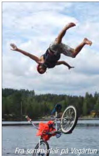
Fra sommerleir på Vegårtun.

Familieleir på Vegårtun Årets familieleir starter søndag 31. juli og varer til fredag 5. august . Vegårtun byr også i år på "lave skuldre", mye flott natur og samvær med mange gode venner med Jesus i sentrum. Leiren er for familier, for enslige og store og små. For mer