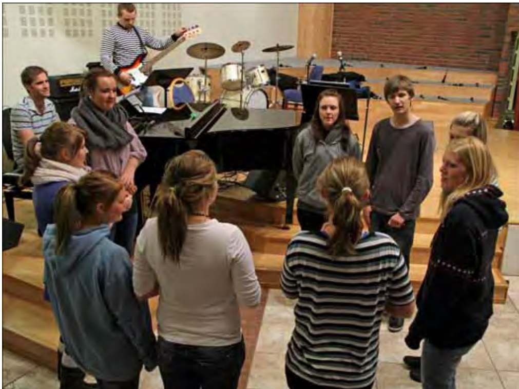
Con Amore er i full gang med sin øvelse