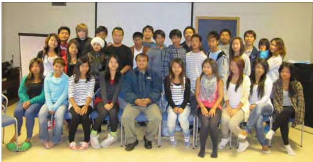
Chinungdommer på høstcamp

I menighetsmøtet i september ble det gitt en positiv melding som gjaldt chingruppa. De ønsket å arrangere ungdomsleir i Baptistkirken i skolens høstferie i oktober – og Høstcamp ble det!