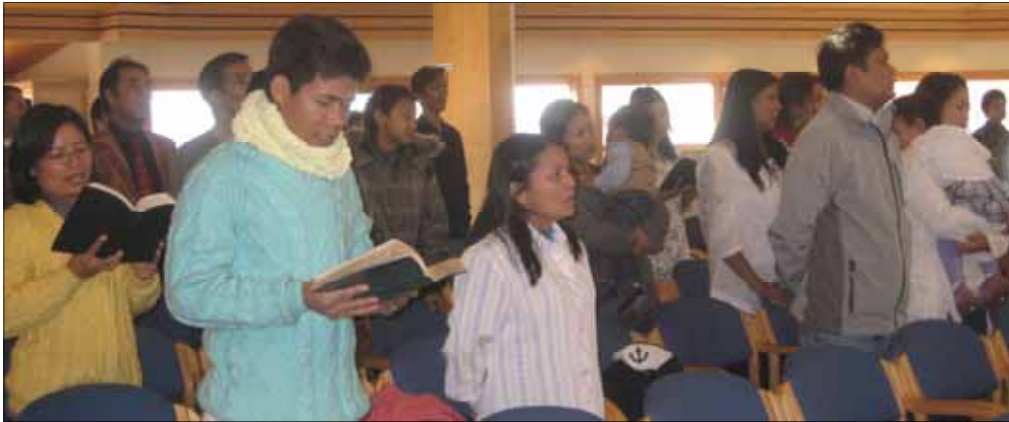
Fellessang under gudstjenesten i kirken.

Det er lørdag formiddag den 13. februar. Det "koker" bokstavelig talt på kjøkkenet i kirken. Masse nydelig mat tilbedres. Det er Chin Christian Family in Telemark, som skal ha møte.