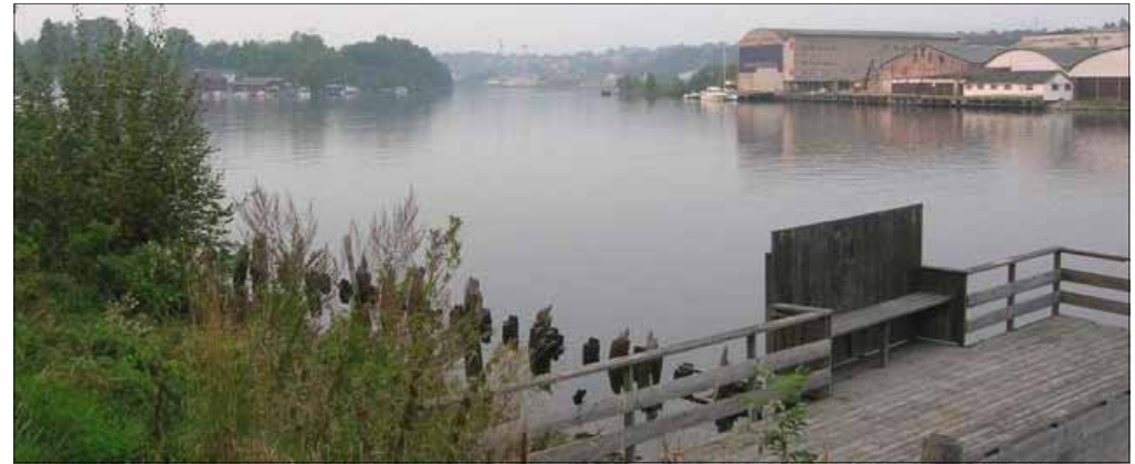
Porsgrunnselva, like nedenfor gården Tolnæs, der den første dåpen skal ha funnet sted.