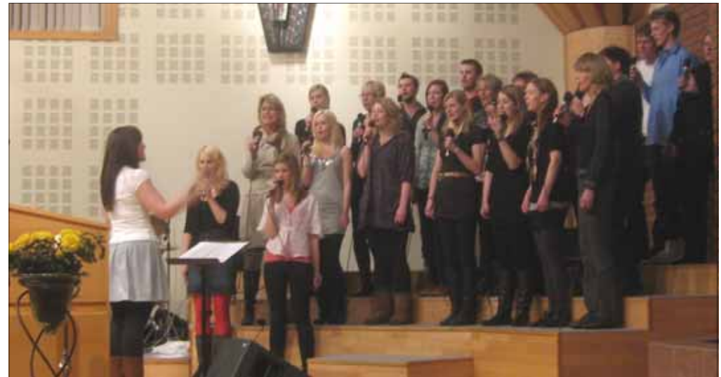
Con Amore med venner synger på gudstjenesten 7. februar

Til sommeren reiser Con Amore med venner, nok en gang på verdenskongress. Denne gangen går ferden til Honolulu 28. juli til 1. august. Vi reiser allerede 23. juli for å syng i en kinesisk menighet i San Francisco.