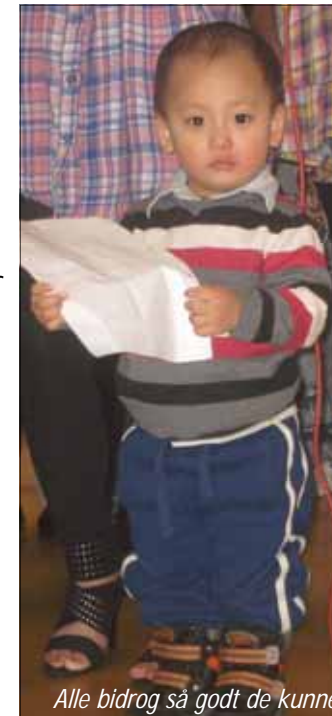
Alle bidrog så godt de kunne!

Jeg reiser hjem med en stor velsignelse i hjertet Disse menneskene, som mange er en del av vårt menighetsfelleskap, har i dag fått berike mitt kristenliv. Tusen takk til dere alle!