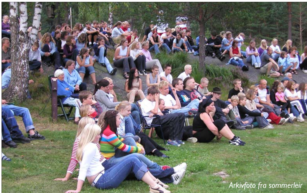
Arkivfoto fra sommerleir