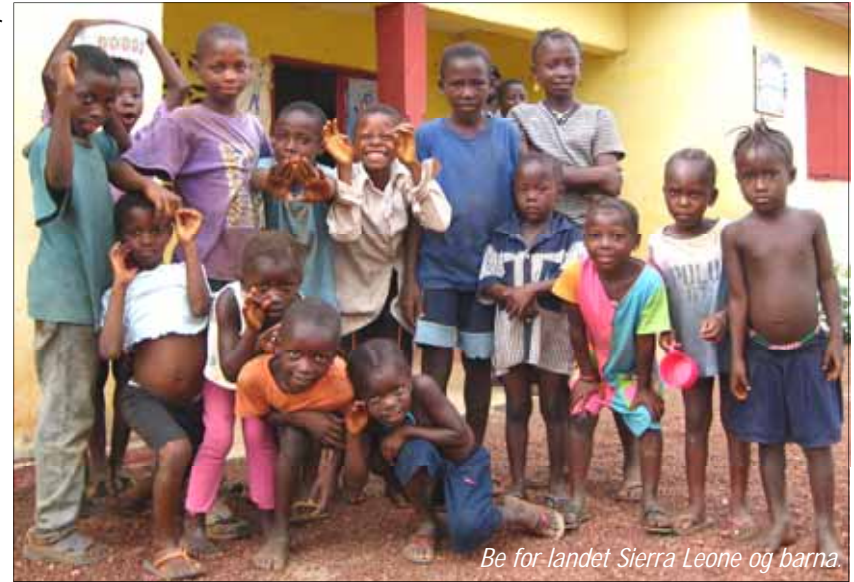
Be for landet Sierra Leone og barna.

og vær" for Stranheim, med undertegnede på slep. Stamstedet vårt ble etter hvert Choitram memorial hospital, et sykehus med indisk opprinnelse og da også stort sett indiske leger. Det