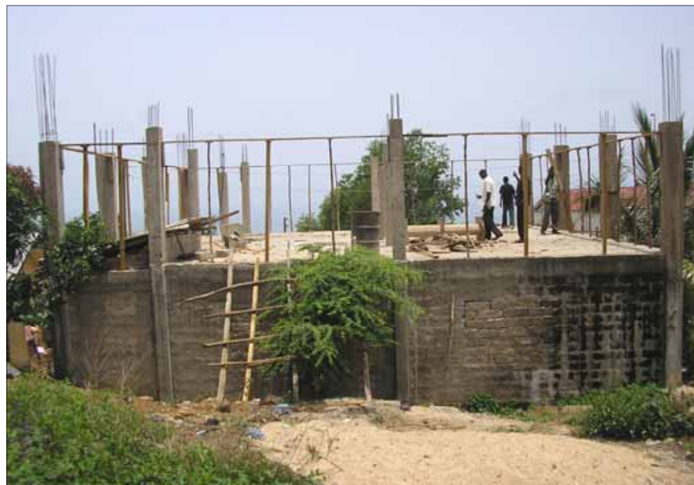
Kirkebygget til Victory Baptist Fellowship