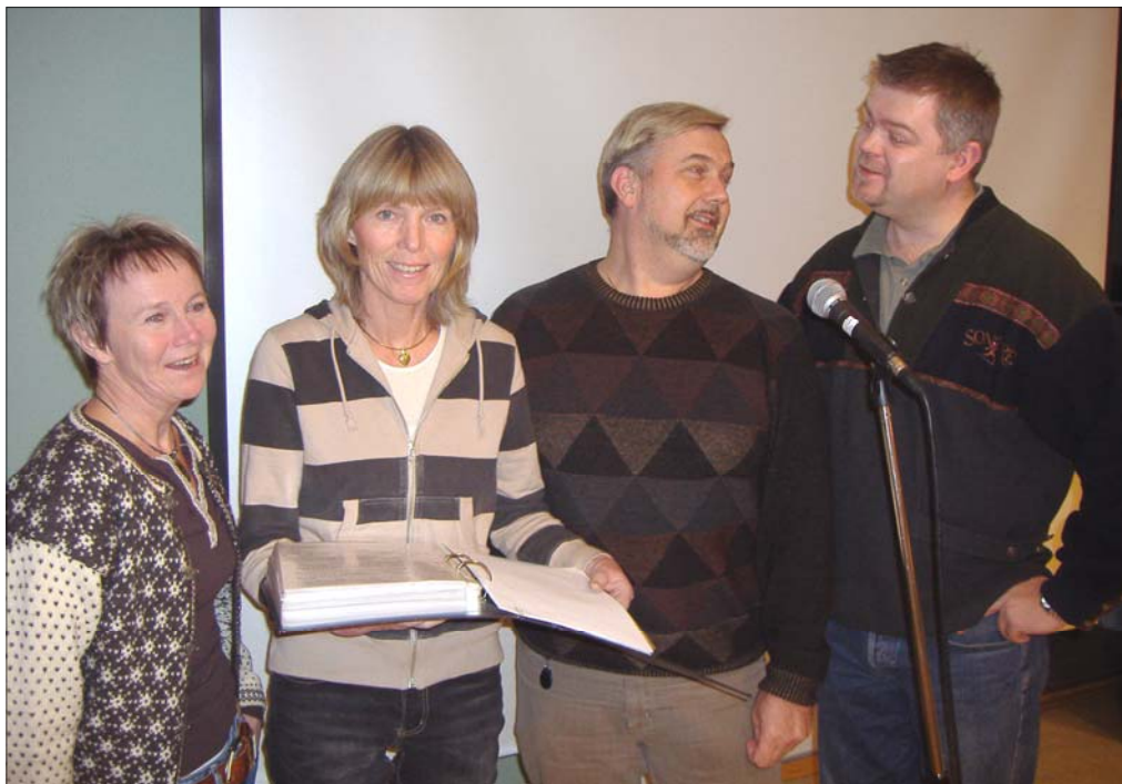
Kanskje denne kvartetten debutterer på sangmøtet?

Du inviteres herved til stort sang- og musikk møte i Baptistkirken. Sett i gang med enkle sangøvelser hjemme i stua allerede nå, for søndag 25. mars klokka 17.00 må du være klar!!