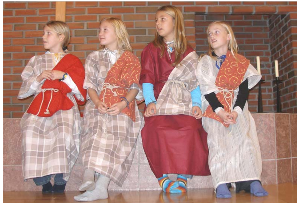
Vertshusansatte venter på Josef og Maria