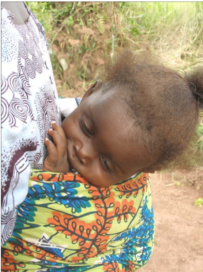
En stor andel av befolkningen i Kongo er barn

Baptistsamfunn betaler en mengde mer eller mindre dokumenterte statlige avgifter. Vise-guvenøren er trøtt, så vi er usikre på om det blir noe gjennomslag for våre synspunkter. Det blir det imidlertid. Toll-, Immigrasjons- og transportmyndigheter blir kalt fram etter tur og orden, og får beskjed om å slutte å trakassere kirken. Tollfrihet blir lovt ved import av varer og ingen flere oppholdsgebyrer utenom visumet. Kirkeledelsen ler og er i skikkelig godt humør etter møtet, for makan har de aldri opplevd. La oss håper disse løftene vil vedvare.