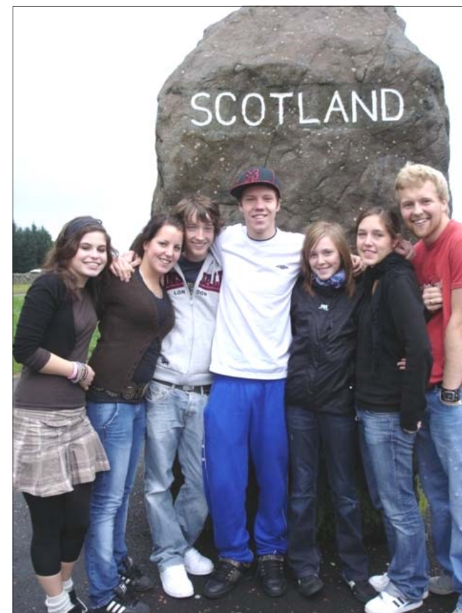
Høstens kortur var Con Amores første besøk i Skottland

Men dette var en kortur så vi skulle selvfølgelig også synge, og da gikk turen videre fra Edinburgh til den lille byen Hawick, en liten skotsk by med ca. 13000 innbyggere. Her ble vi møtt med et fantastisk måltid og en utrolig gjestfrihet. Det var en liten gjeng med gamle damer på ca. 5, som ordnet mat til oss, morgen og kveld. Det var ikke så mange ungdommer i menigheten, og vi kan vel ganske sikkert si at majoriteten av