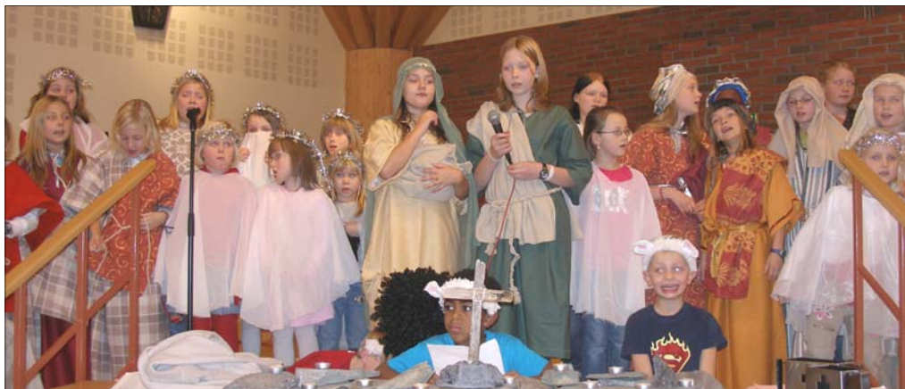
Hele Logos er med på musikalen