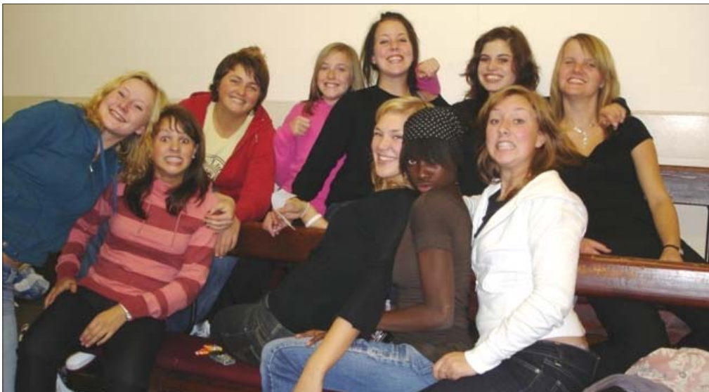
Jentene på kortur i Hawick

Første søndag i høstferien, søndag 9.oktober, stod Con Amore utenfor Baptistkirken, klare til tur. Med et smil om munnen og passet i lomma, satt vi nesa i retning et land vi aldri tidligere hadde besøkt, nemlig Skottland.