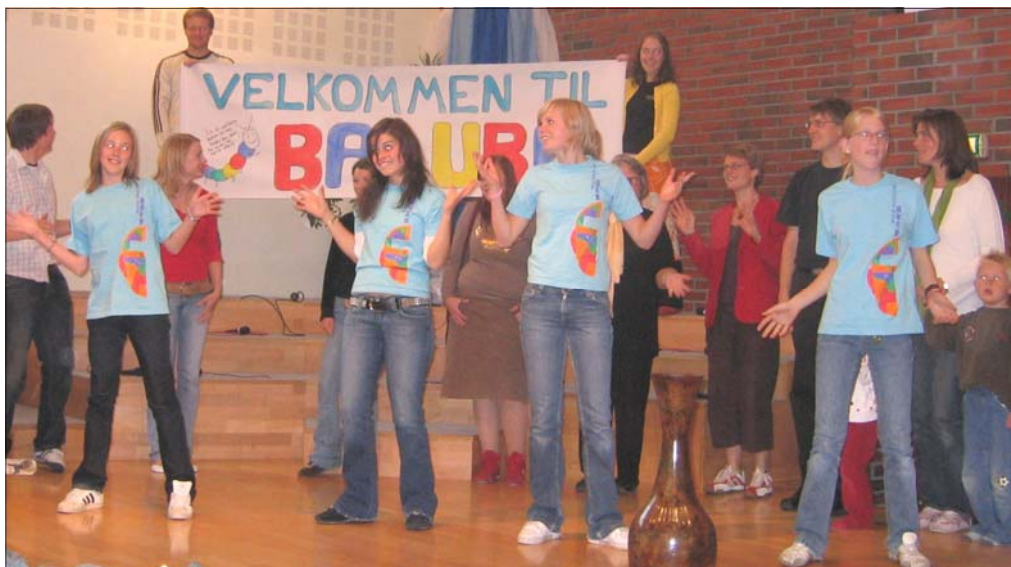
Balubalederne ønsker velkommen

Søndag 18. september var en dag som mange hadde sett frem til med spenning og glede. Dette var oppstarten for søndagsskolen Baluba. Navnet ble dannet i våres etter en navnekonkurranse. BA står for barn, L står for levende, lek og læring, U står for undervisning og underveis og BA til slutt står for baptist.