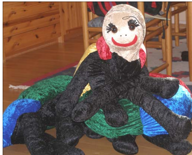
Tusenbeinet er maskotten for Baluba

Mange medhjelpere Hensikten med en ny organisering av søndagsskolen er at ansvaret delegeres ut til mange personer. Dermed blir det ikke bare noen få som ansvaret hviler på. Pr. i dag er det 31 ulike medarbeidere i Baluba. I tillegg er det 17 stykker som har sagt ja til å være forbedere. Oppgavene er fordelt på sang, musikk, teknisk, undervisning,