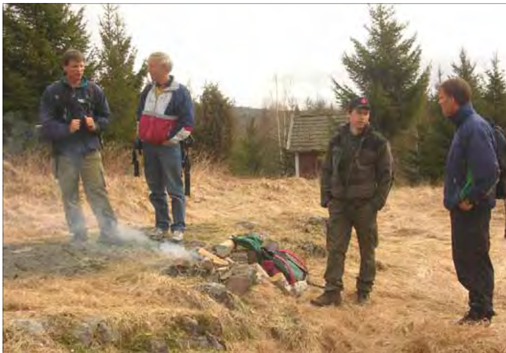
Hvordan i alle verden skal vi få fyr?

Det er kanskje for sterkt sagt at menighetens turgruppe har kommet for å bli, men det kan i alle fall virke som om oppslutningen om turene er stigende!