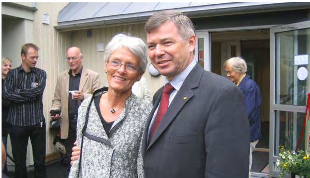
Statsminister Kjell Magne Bondevik åpnet hybelhuset til Skien Diakonale Senter

Statsminister Kjell Magne Bondevik foretok den offisielle åpningen av hybelhuset til Skien diakonale senter tidligere Kontaktsenteret. Egentlig var det tre måneder siden hybelboerne flyttet inn, men den offisielle åpningen skjedde først da Kjell Magne Bondevik kunne komme 31. mai.