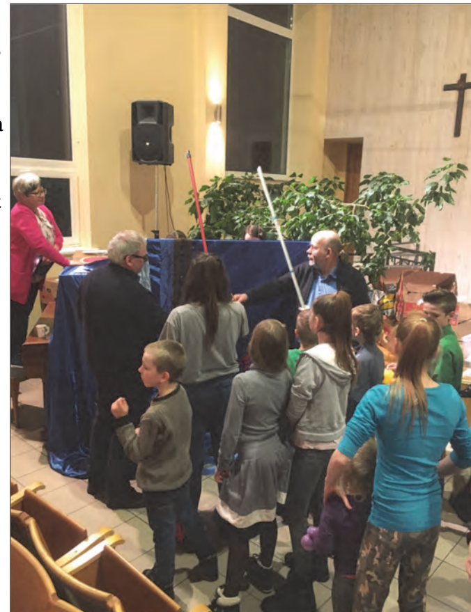
Fiskedammen på «Happy day» var populær!

Siste dagen i Ogre delte alle litt om hva de syntes om turen. Da vi kom hjem til Skien, gjorde mange det samme i kirka. Alle ga veldig positive tilbakemeldinger, og det blir mange ulike inntrykk gjennom ei slik uka.