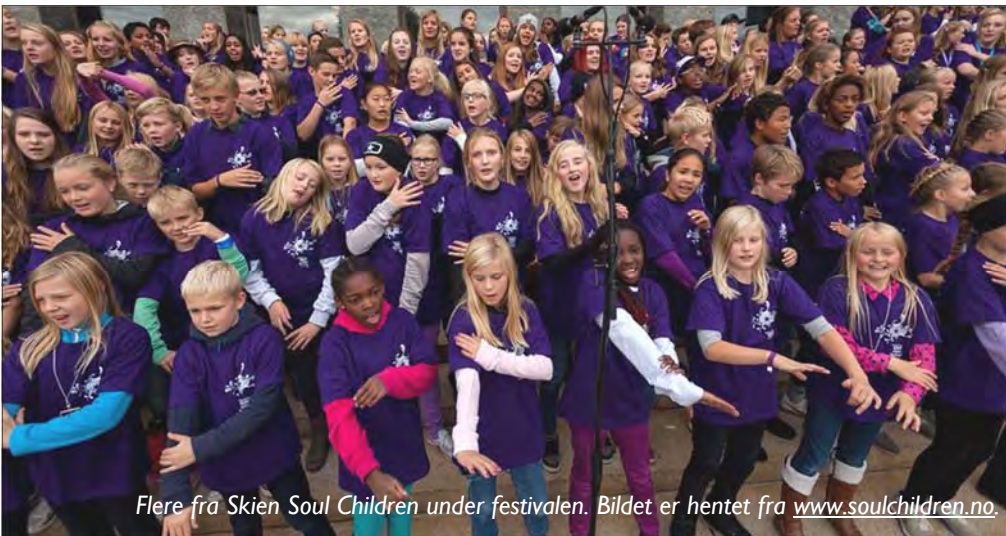
Flere fra Skien Soul Children under festivalen.

1500 "tweens" fra 10-16 år synger, gynger, vinker, klapper i takt og smiler bredt på Rådhus-trappene midt i Oslo sentrum - det gjør et enormt inntrykk! 22 av disse engasjerte barna og ungdommene kom fra vårt eget "Skien Soul Children", og vi har som menighet grunn til å være så stolte av og takknemlige for dem!