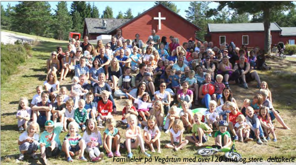
Familleleir på Vegårtun med over 120 små og store deltakere