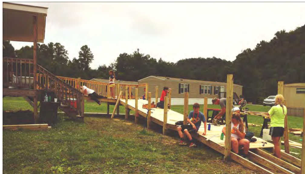
"Å være levende reklame i handling" var viktig for ungdommene som var på misjonstur til USA.

Da vi dro på denne turen hadde jeg ikke forventet at den ville forandre meg på den måten den gjorde. Og jeg er ikke den eneste av deltakerne som har sagt dette, for denne turen har vært et høyde-