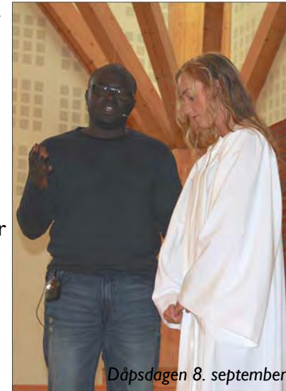
Dåpsdagen 8. september

Jeg likte godt at det var en tur der det var lagt opp til opplevelser – ikke bare strandliv! Det var veldig spennende å besøke en bibelskole hos Lahu – stammen. Her spiste vi forresten ris til alle måltider, og etter 3 dager var det nok! Jeg er veldig glad for at jeg hadde med knekkebrød i bagasjen! Her ble vi kjent med flere ungdommer selv