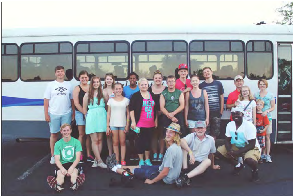
Misjonsteamet sammen med familien som hjalp dem med å tilrettelegge turen i Virginia.