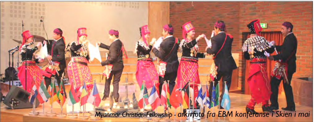
Myanmar Christian Fellowship - arkivfoto fra EBM konferanse i Skien i mai