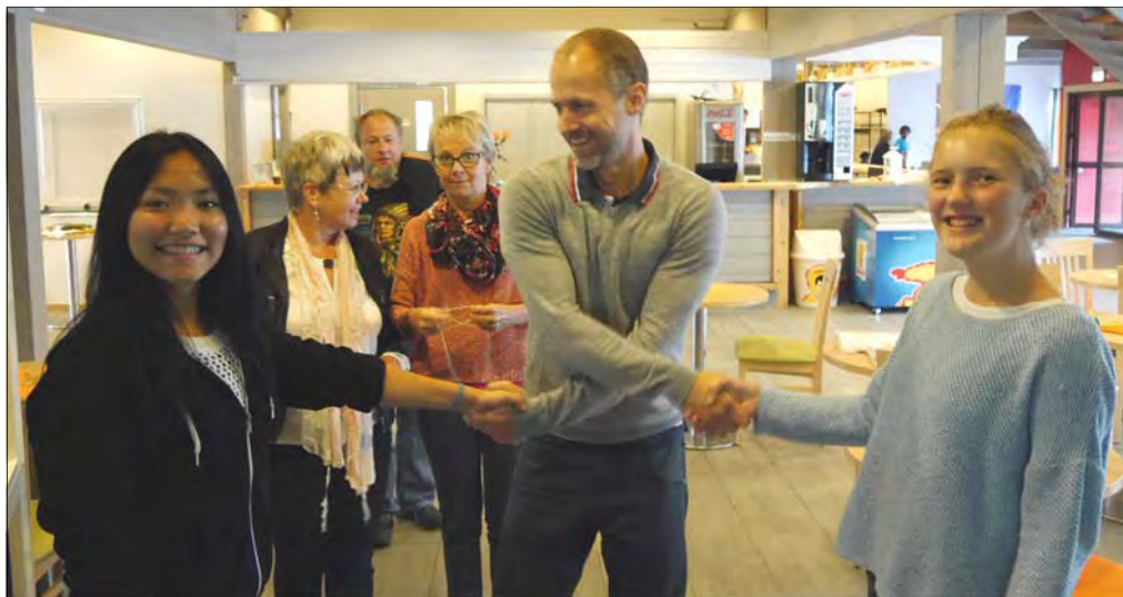
Godhet kan formidles på mange måter!

Godhet er en av våre verdier i menigheten. Det har vi kommet fram til gjennom verdi / strategiprosessen som har pågått det siste året. Hva tenker vi om det å gjøre denne verdien synlig i menigheten og i samfunnet rundt oss?