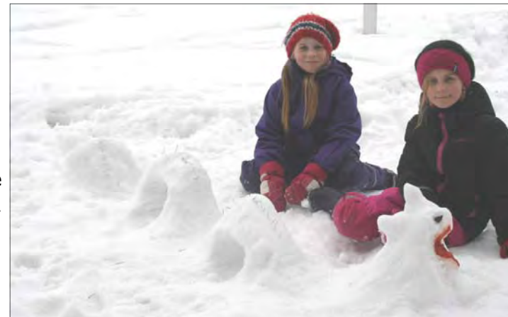
"Sjøormen" ble kåret til den beste snøskulpturen.