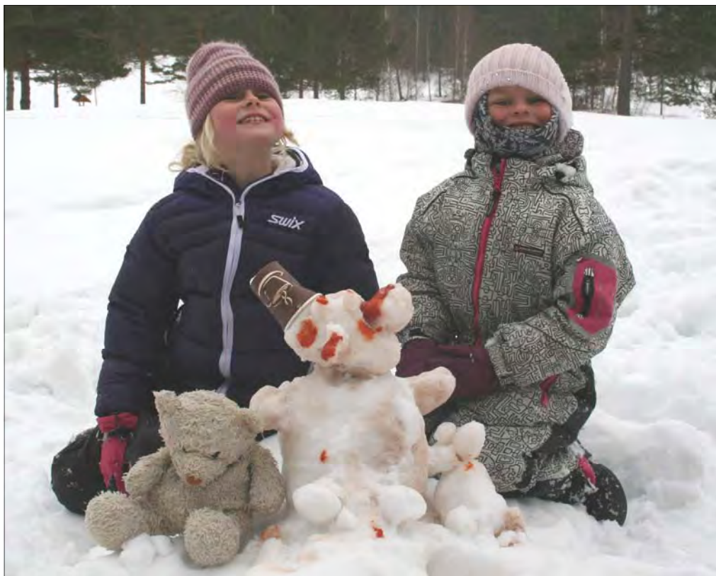
"Bamsene" ble kåret til den morsomste snøskulpturen.

Sørlandets baptist ungdoms juniorleir på Vegårtun ble i år holdt den første helga i vinterferien, 17.-19. februar. Dette er en leir der 3.-7. klassinger får høre om Jesus, syng, filme, spille og leke masse ute i snøen.