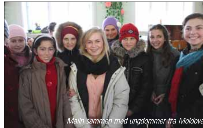
Malin sammen med ungdommer fra Moldova

Nabobygningen er den lokale baptistkirken. Her er noen av inntrykkene etter gudstjenesten: «Barnekoret var bra.» «Gudstjenesten var bra. Mye sang.» «Kirken var så gjestfri.» «Morsomt å synge uforberedt i kirken. Gjorde noe med stemningen.» «Jeg likte veldig godt gudstjenesten. Det var så gøy at alle sang. Det virket som at alle i kirken var med i et av korene. Presten virket inspirerende. Alle var