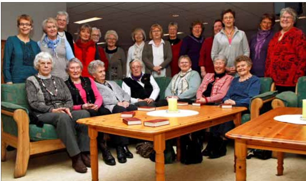
Stor deltakelse på Allehånde.

Det begynte med en tankeutveksling i forkant av innvielse av ny kirke. Noen representanter for "det svake kjønn" stakk sine hoder sammen og kom til den konklusjon at det var behov for et forum for kvinner. Som tenkt så gjort, og navnet ble Allehånde.