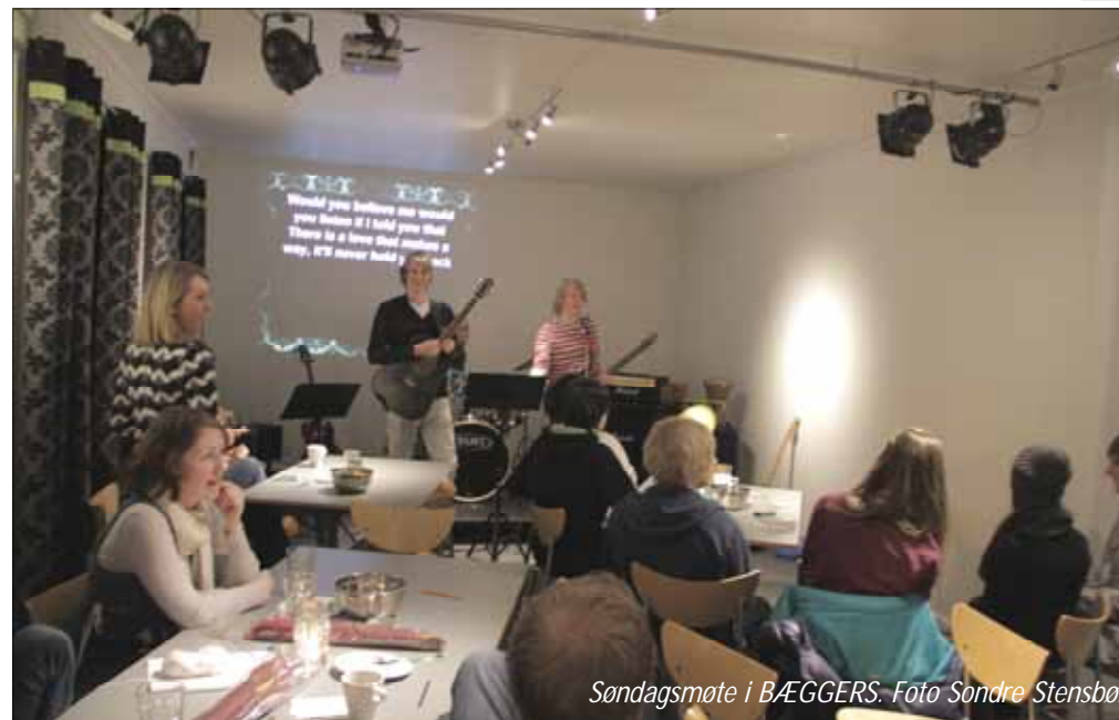
Søndagsmøte i BÆGGERS.