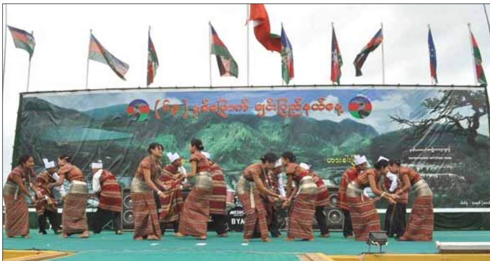
Fra nasjonaldagen i Hakha, Chin hovedstat i år. Det står Chin stat dagen med stort skrift på burmesisk.

20. februar er nasjonaldagen for chin-folket. I år feiret chin-folket i Telemark og Aust-Agder sin 63. nasjonaldagen for første gang i Telemark. Det ble holdt en stor fest i Ibsenhuset sammen med norske venner.