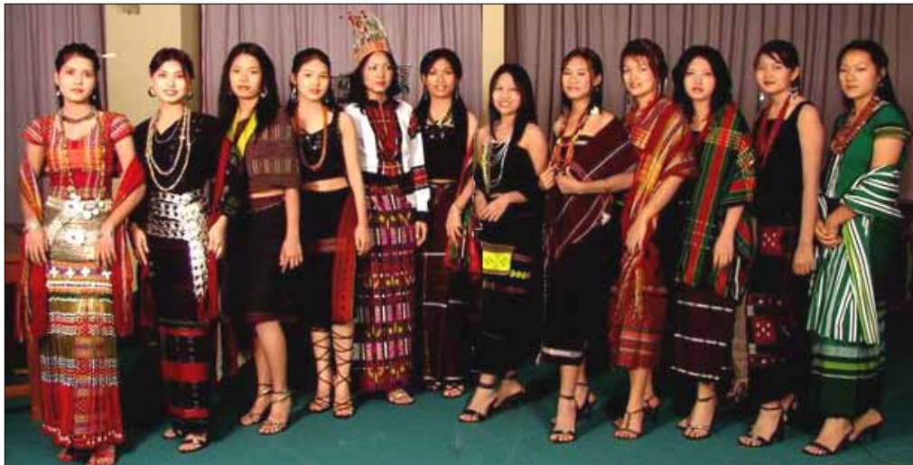
Ulke folkedrakter fra Chin - staten. Det ble også vist mange flotte drakter under feiringen i Skien

Nasjonaldagen og stat dagen har historisk og politisk sett forskjellige betydninger. Militærregimets langtidsplan er å fjerne alle religioner unntatt budismen, alle nasjonaliteter unntatt burmanere og alle språk unntatt burmesisk. Det er ikke lov å lære Chin språk på skolen. Det er mye smerte som mishandling, undertrykkelse og mangel på frihet, chin - folk opplever pga. religion og nasjonalitet. Militærregimet har en tid kjøpt opp Chin -folkets nasjonaldrakter og smykker, for å forhindre at de blir brukt. I dag blir en del smykker til nasjonaldraktene