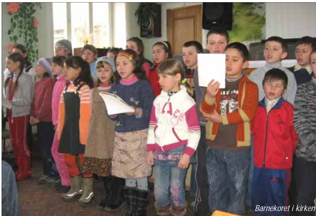
Barnekoret i kirken

K2 besøkte Moldova i vinterferien for å bli kjent med Misjon uten grensers arbeid. K2 er et leder- og disippeltreningskurs for ungdommer i kirken over konfirmantaler. Med ledere var vi 17 personer på reise. Her kommer noen inntrykk fra vår første hele dag i Moldova, søndag 20. februar.