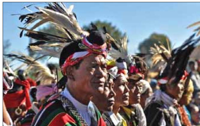
Nasjonaldag feiring i Mindat, der første nasjonaldagen ble feiret.