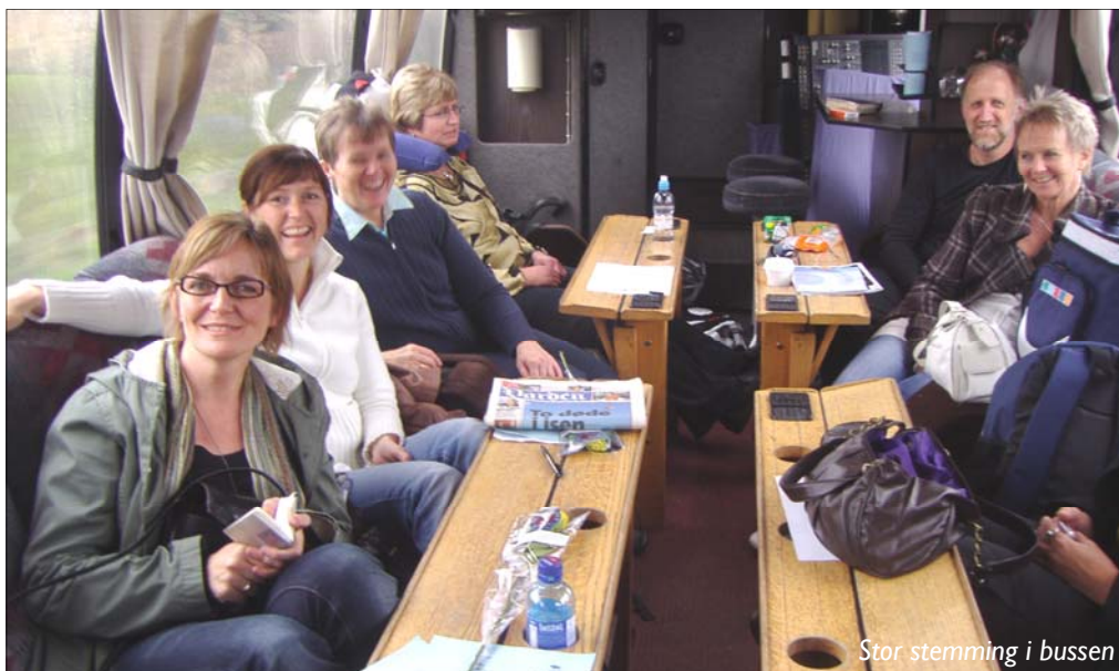
Stor stemming i bussen

Foreløpig er det lite som tyder på at det kan bli platekontrakt. Det er heller ikke meldt om en umiddelbar lansering av Basis i Sverige. Men at menigheten i Falkenberg tok godt imot sangen til Basis, det stemmer i alle fall!