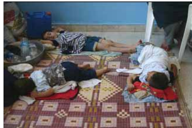
Flyktningbarn sover på baptistskolen i Beirut

Beirut Baptist School har 1200 elever, hvorav 1100 er muslimer. De hører evangeliet hver dag. De lærer Bibelen svært godt. Vi gir dem god eksamen, kristen