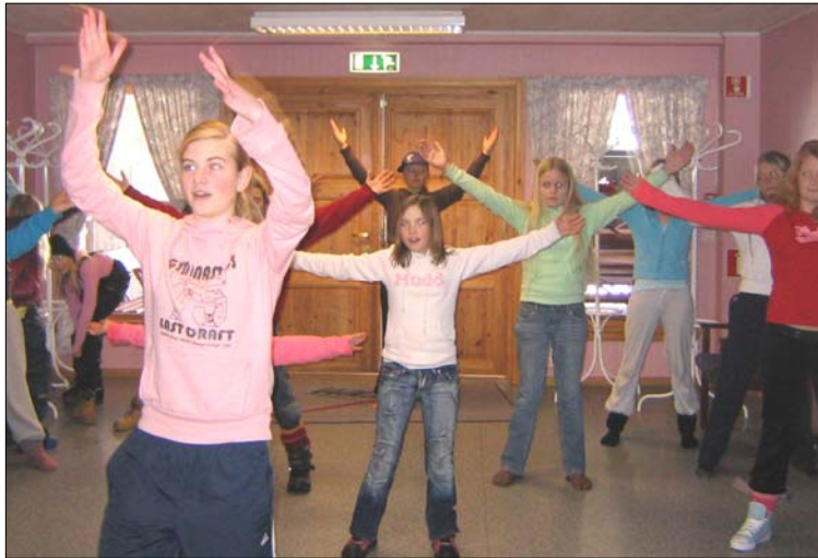
Trivelig på barneleir