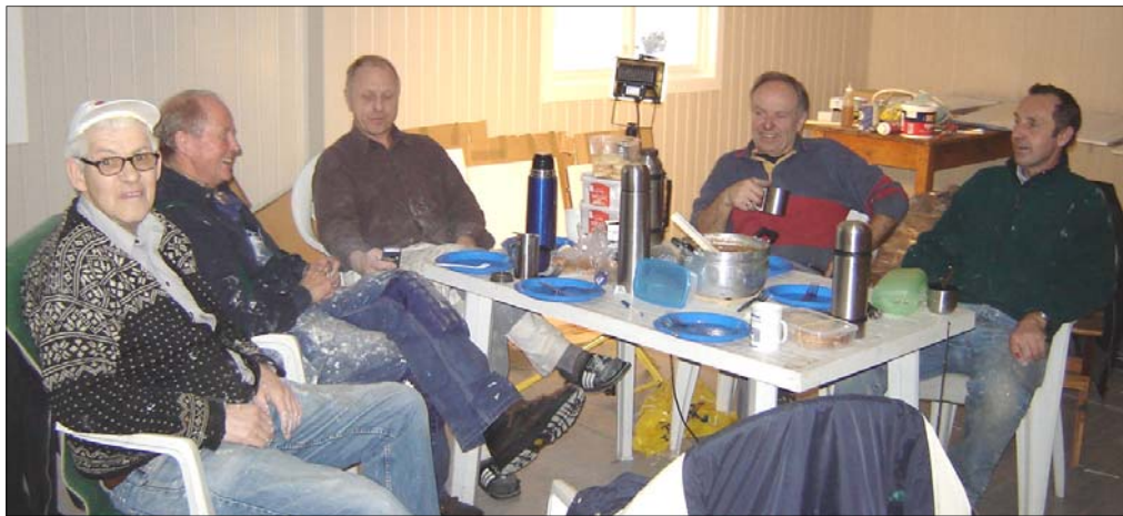
En kaffekoppe eller to hører med for dugnadsgjengen

Mange arbeidstimer har gått med og flere liter kaffe. Men nå står den snart ferdig til bruk, speiderhytta i Luksefjell.